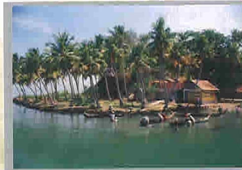
Kerala: God's own country