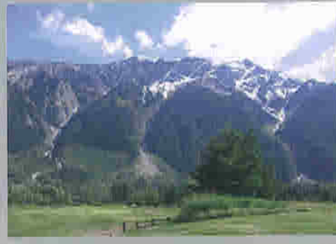
British Columbia: Best Place on earth

Sunday, 1:00pm 16870 80 th Avenue Surrey