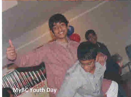
MyBC Youth Day