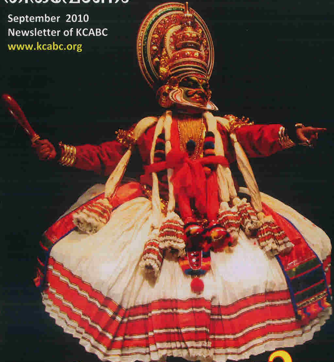
From the Kathakali performance held on 21 August 2010