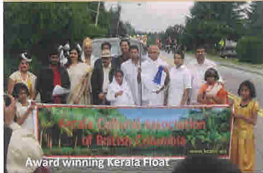
Award winning Kerala Float